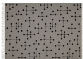
Dot Pattern, 1350 x 2000 mm Achterkant