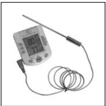
Item #: 14.491.16