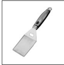
Item #: 14.112.36