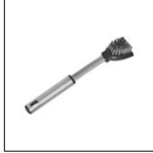
Item #: 14.421.10