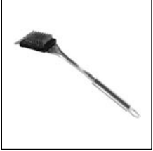
Item #: 14.421.12