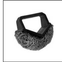
Item #: 18.211.52