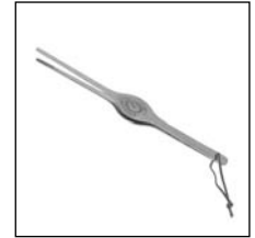
Item #: 14.112.23