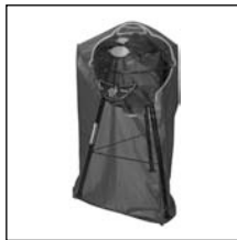
Item #: 18.221.08