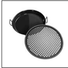
Item #: 18.211.32