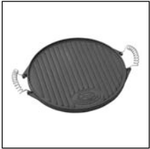
Item #: 18.211.25