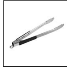
Item #: 14.112.35