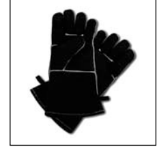
Item #: 14.491.10