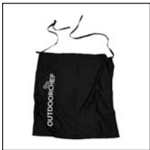
Item #: 14.112.24