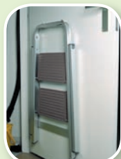
De Giant is uiterst compact en daardoor makkelijk op te bergen