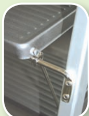
Door de degelijke constructie staat de Giant garant voor duurzaamheid en veiligheid